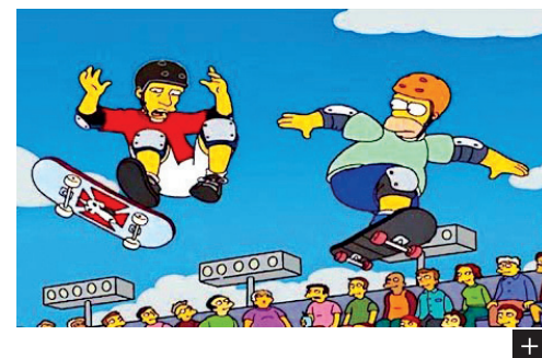
A sinistra, Tony Hawk. In alto, il post pubblicato il giorno delle dimissioni del presidente Obama in cui ricorda la corsa in skate nei corridoi della Casa Bianca. Sopra, Hawk in una puntata dei Simpson . Nella foto grande, l'atleta durante una sua esibizione acrobatica

Goodbye @BarackObama, thanks for letting me skate in the House.